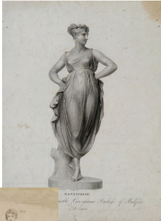
Fig. 1 - Antonio Canova, Danzatrice con le mani sui fianchi . Incisore: Pietro Fontana; disegnatore: Giovanni Tognoli.

alle 20, venerdì dalle 15 alle 23, sabato e domenica dalle 10,30 alle 20,30) l'Ente Fiera conclude e presenta il progetto di restauro e messa in sicurezza del terzo e ultimo ciclo di incisioni ottocentesche da Antonio Canova.