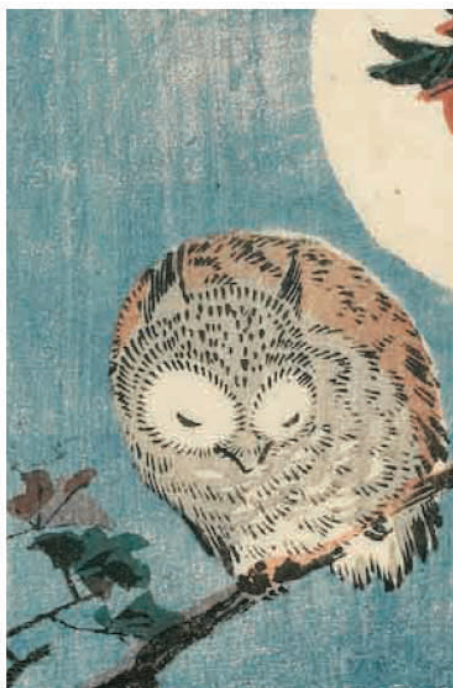
HIROSHIGE IL MAESTRO DELLA NATURA