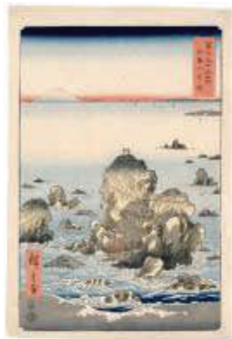
Futamigaura a Ise