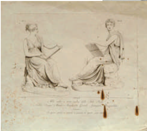
Fig. 2 - Antonio Canova, La musa Polimnia . Incisore: Pietro Fontana; disegnatore: Giovanni De Min, 1817