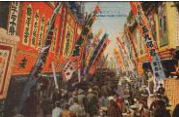
Asakusa Park Tokyo / Asakusa kōen katsudō