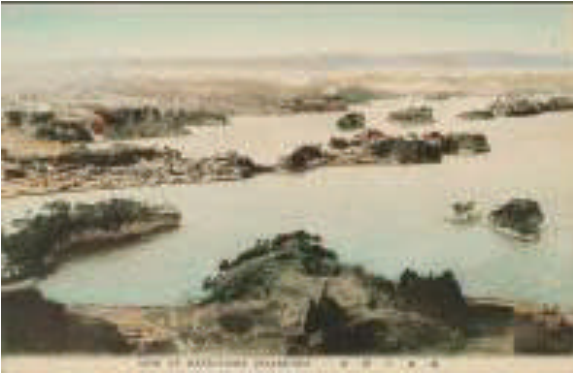
View of Matsushima Inland-Sea / Matsushima no zekkei

Uno scambio, una comunione di spiriti particolarissima. Copiando Hiroshige, Van Gogh cercava infatti la chiave per meglio penetrare il sentimento della natura. “Giapponesi così semplici”, scriveva Van Gogh da insegnarci una cosa importante,