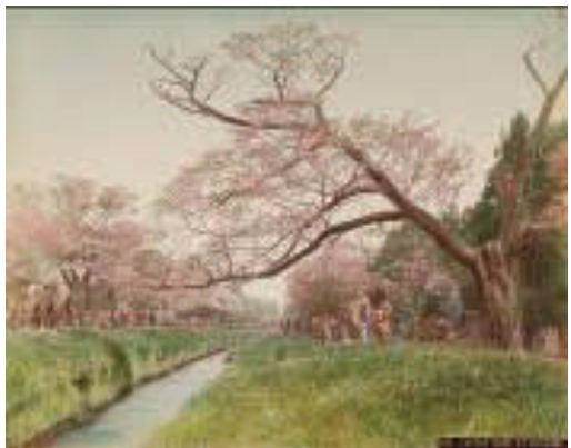
Autore non identificato "Ponte di Arashiyama, Kyoto"