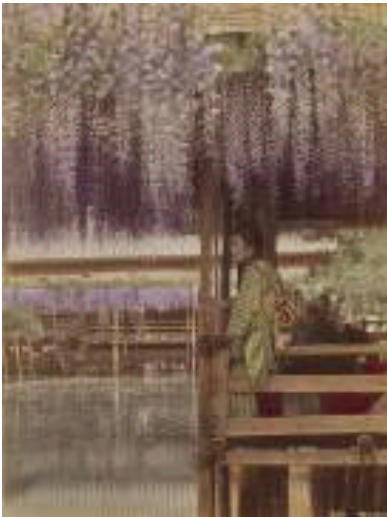
Kusakabe Kinbei Ponte di Arashiyama

o per i loro valori mitologici, letterari o come frequentati punti d'incontro. La terza "La via per Kyoto" è dedicata alle due grandi vie che collegavano la capitale imperiale di Kyoto a quella amministrativa di (Tokyo) Edo, rispettivamente lungo la costa (Tōkaidō) e nell'interno (Kisokaidō). In questa sezione è contenuta l'opera Cinquantatré stazioni di posta del Tōkaidō, universalmente considerato il capolavoro di Hiroshige realizzato intorno al 1834, poco dopo il viaggio fattovi dal grande maestro. Nella quarta "Nel cuore di Tokyo" è rappresentato il vedutismo di Edo, la